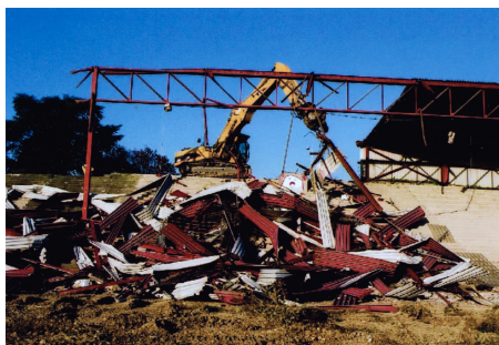
Les grues sont entrées en action. D'ici au mois de janvier, les deux tribunes encore debout seront démolies. Des logements et un grand parc public prendront place dans cet espace.